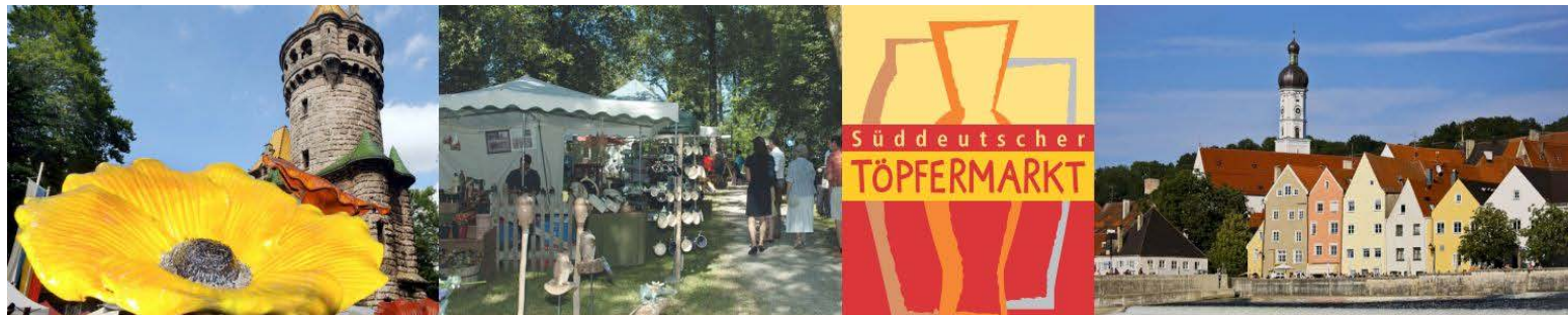
Süddeutscher Töpfermarkt in Landsberg am Lech